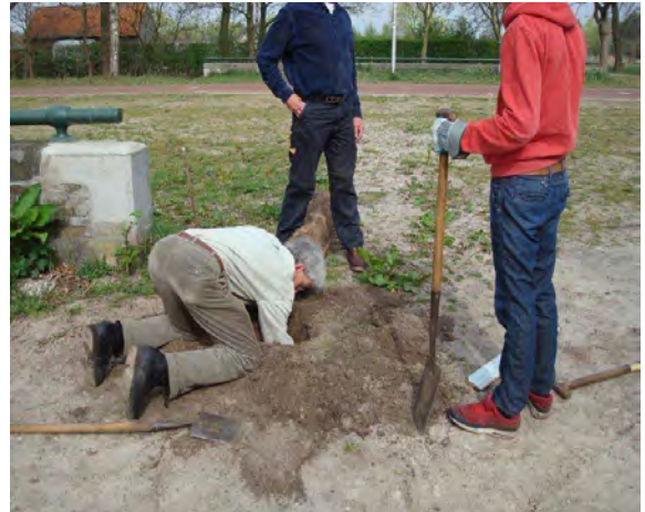
uitgraven van paalgaten

Na een week zijn de plaatjes in een avond door vrijwilligers op de 33 palen geboord d.m.v. rvs-schroeven.