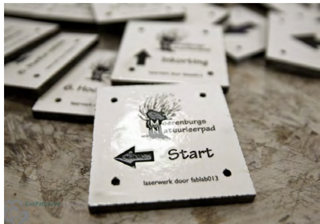
33 trespas plaatjes met diepdruk