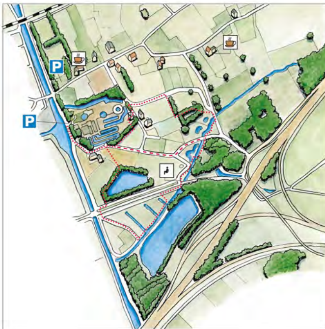
ontwerp van de route Natuurleerpad Moerenburg

4 Maanden vóór de opening is door VNAS een 10-tal vragen en opdrachten gemaakt voor de 10 punten van het Natuurleerpad. Deze zijn, na advies op taalgebruik door een buurtraadvrijwilligster, vastgesteld en aan de ontwerpster van het bord en folder als voorwaarde gegeven. De route is in een tekening verwerkt door een ontwerpster en samen met de uitleg en sponsorlogo's tot een ontwerp voor een dubbelzijdig startbord en identieke folder verwerkt. Er is hier een tijdsplanning bij gemaakt die zorgde dat alles op tijd klaar was.