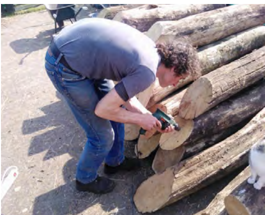
aanbrengen van 4 gaten in de 37 palen

Na het vaststellen van de lengte van palen en de duurzaamheidsklasse hebben we lokaal een leverancier gevonden die de palen heeft gemaakt. Wij hebben zelf het vervoer (37 palen x 35kg = 1300kg) naar Tilburg gerealiseerd. Opslag bij een bewoner in Moerenburg. Zelf hebben we per paal de boorgaten gemaakt voor de bordjes. Alle bordjes zijn door ons op maat gemaakt en door ons van 4 gaten voorzien.