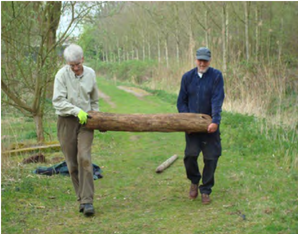
aanvoeren van de palen

Nadat alle plekken van de palen door VNAS met de Werkgroep Behoud Moerenburg (WGBM) waren afgestemd heeft VNAS die uitgezet d.m.v. markeringen. Daags erna zijn 8 vrijwilligers de hele dag bezig geweest om de gaten te boren, palen uit te delen op de plantplaatsen en de palen te zetten en verdichten van de grond er omheen.